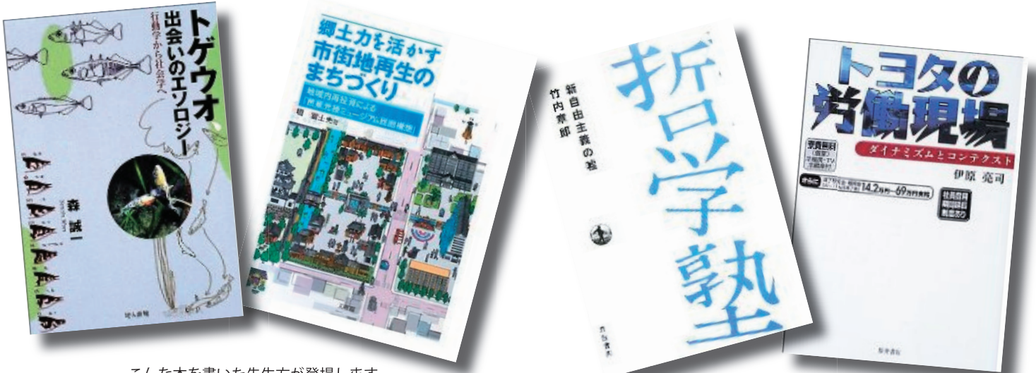
こんな本を書いた先生方が登場します