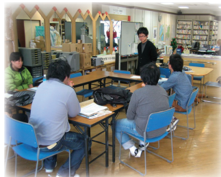
大垣市東外側 2-6 広瀬第一ビル 1階